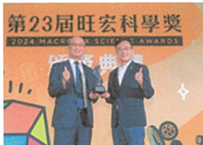
教育部次長林騰蛟多次出席活動給予指導與鼓勵