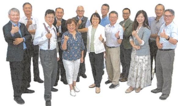
旺宏科學獎評審團陣容堅強