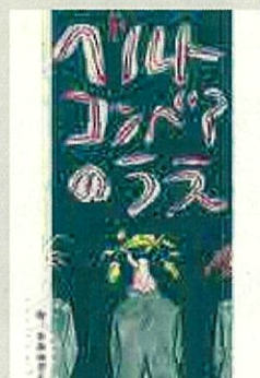
故事漫畫【自由組】 作品名:在傳送帶上 筆名:NARUHANOTO