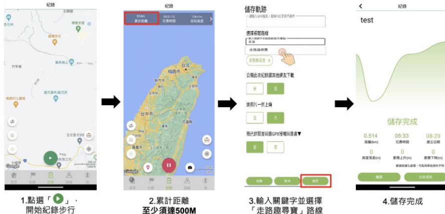
圖 4、Android 系統流程說明