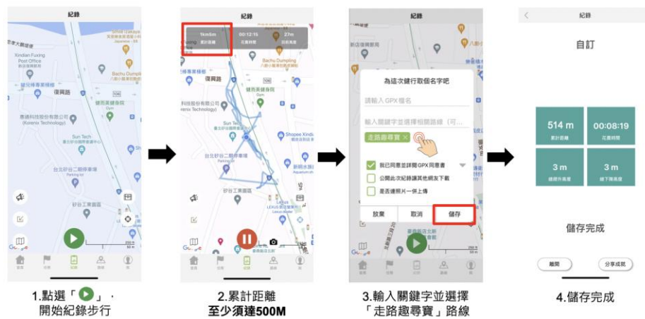
圖 3、iOS 系統流程說明

進入「健行筆記 App」後，點選「紀錄」開始步行，累計至少 500 公尺步行距離後，結束時自訂 GPX 檔名並於相關路線輸入關鍵字選擇「走路趣尋寶」路線，點擊儲存後即可獲得抽獎機會。