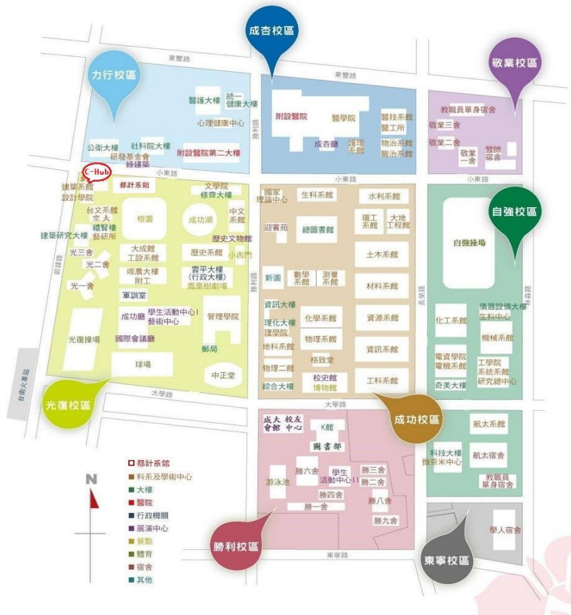
圖 2-C-Hub 創意基地位置圖