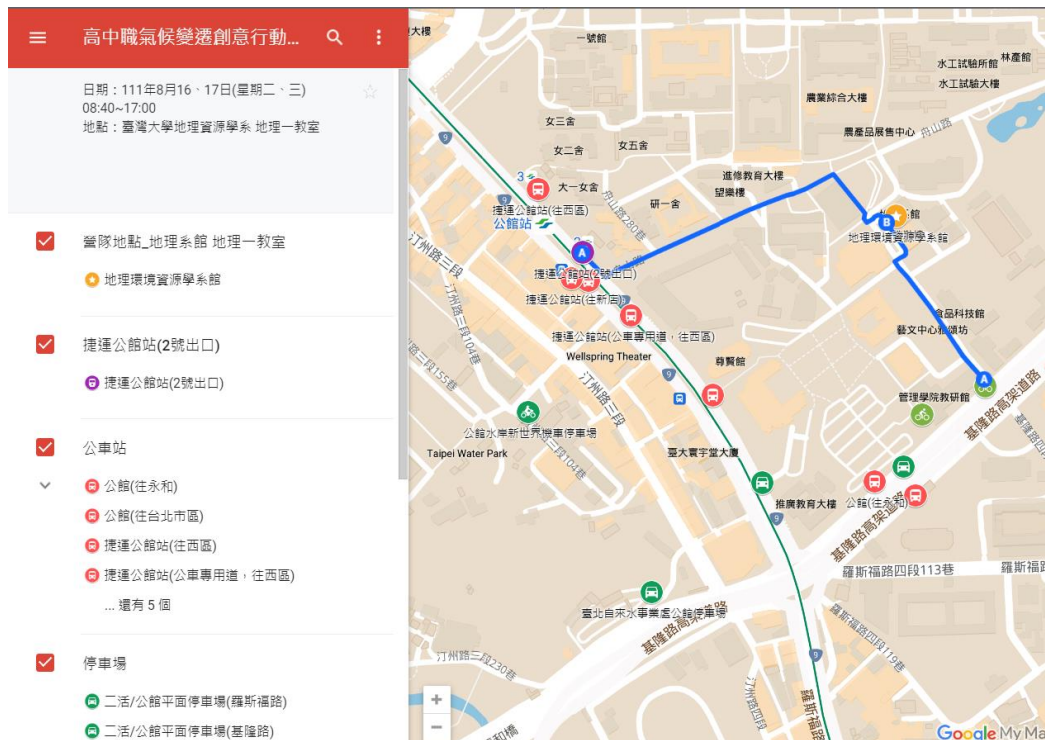
圖 1-臺灣大學交通地圖