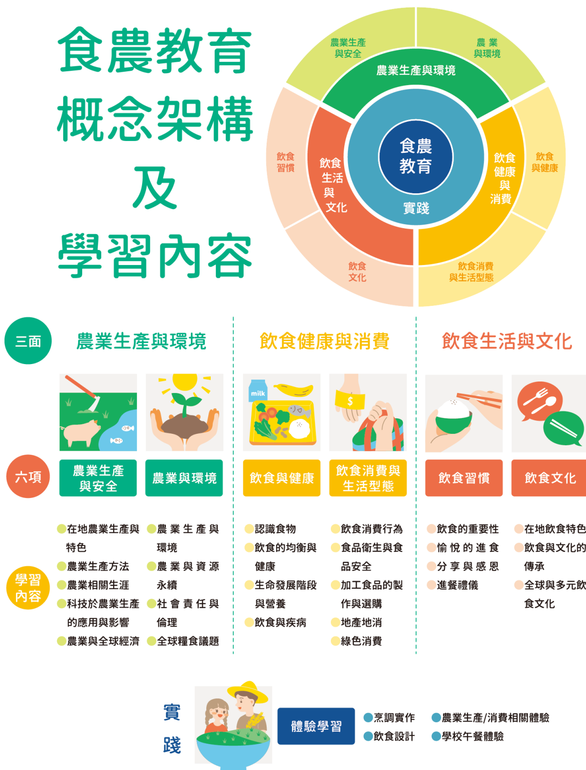
圖 1 食農教育 ABC 模式：食農教育三面六項

資料來源：林如萍，食農教育之推展策略（一）：學校教育實施之概念架構分析，106 年度國立臺灣師範大學產學合作計畫研究報告，頁 28。