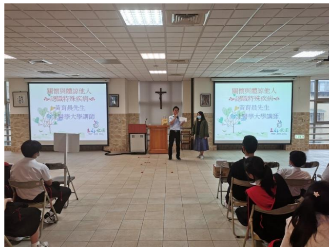
關懷與體諒他人講座