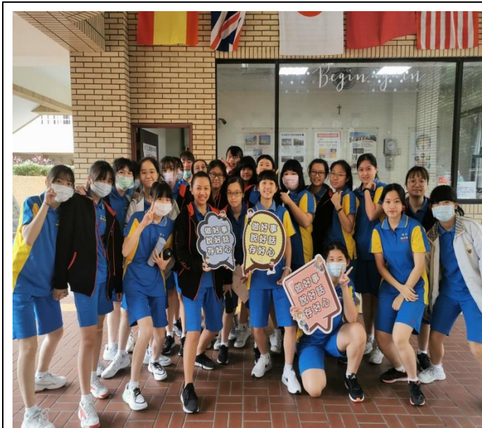
製作三好宣導板，向同學進行宣導