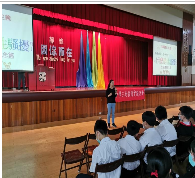
邀請家防官來校做性騷擾防治演講，讓男女同學學會彼此尊重