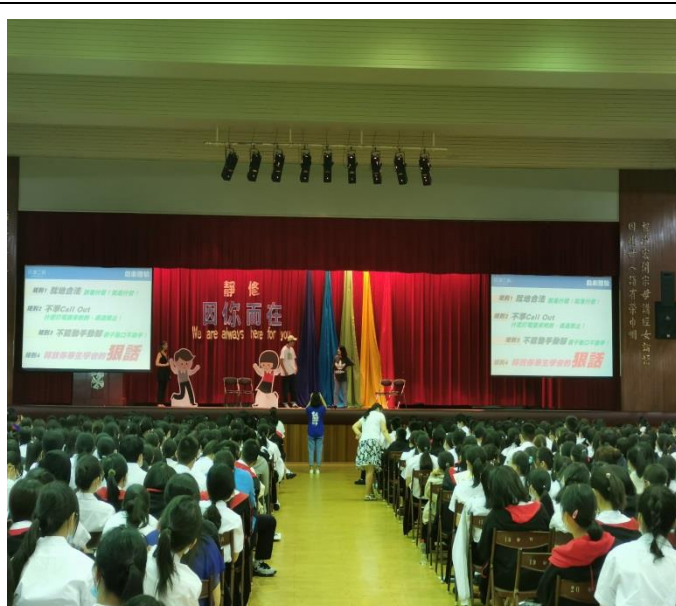
邀請故事工廠，透過肢體解說讓同學培養同理心