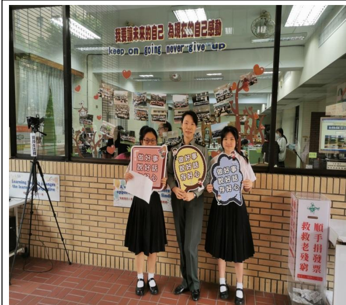
同學和主任教官了解三好理念後，手執宣導板合照