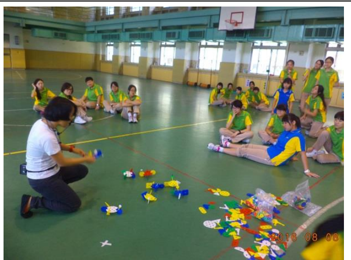
心靈成長探索教育