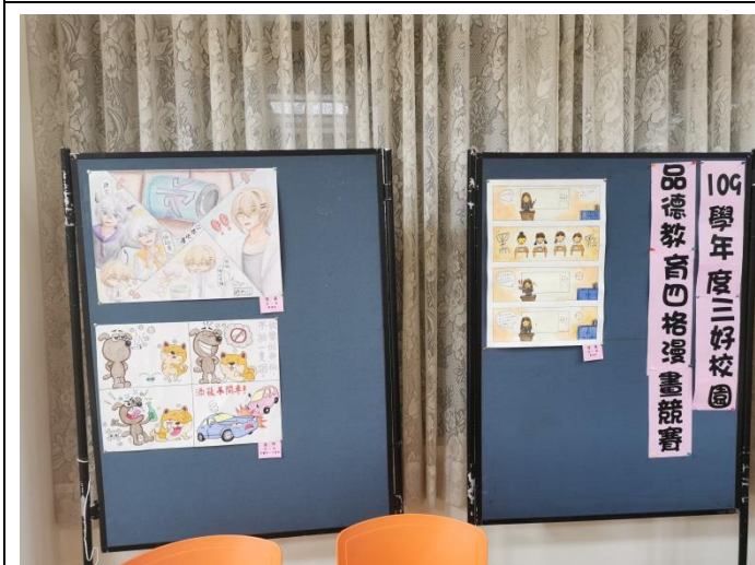
三好校園四格漫畫