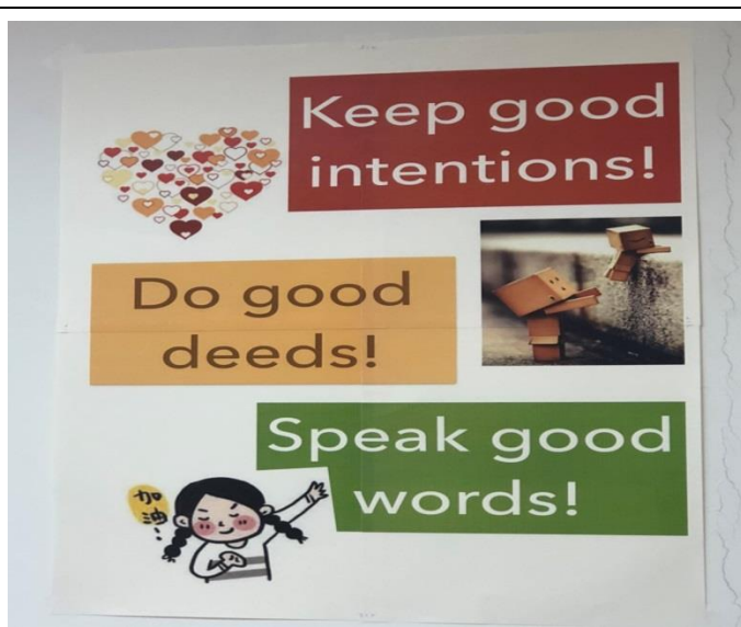
英文老師自行設計三好校園布置