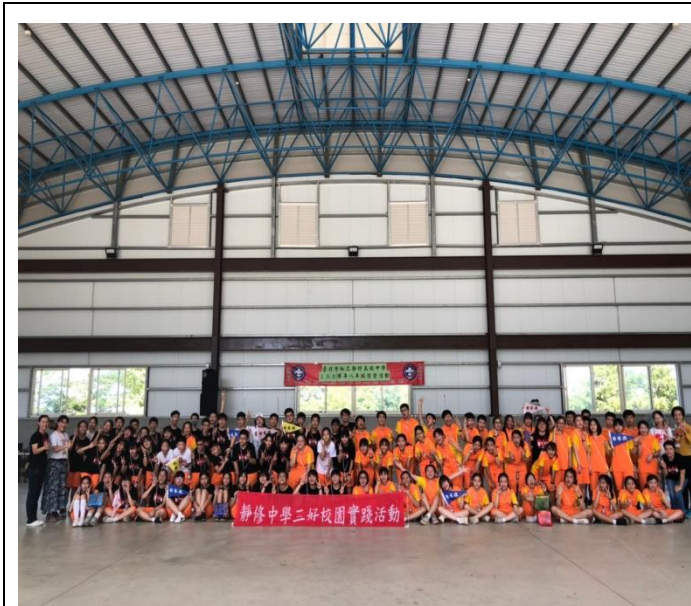
隔宿露營，培養同學團結、合作的精神