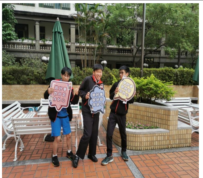
本校男同學自行來表示想理解三好理念，之後並且手執宣導板拍照