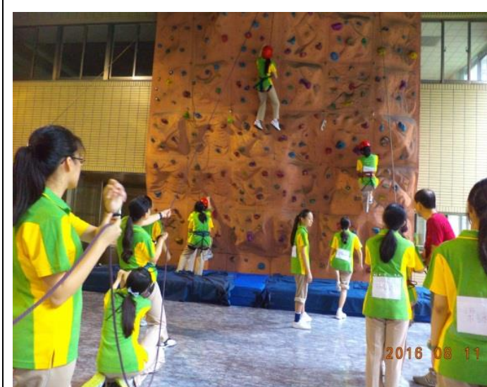
心靈成長探索教育