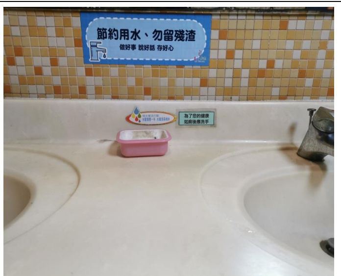
搭配佳言，製作貼紙張貼於洗手台