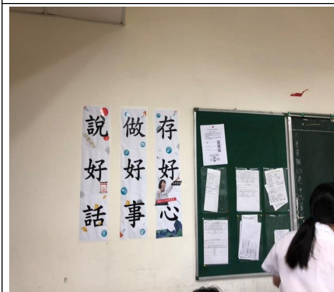
教室內做三好標語布置