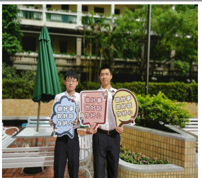
同學接受宣導後拿宣導板拍照