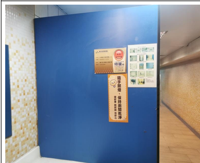
製作三好貼紙，張貼於廁間入口進行宣導