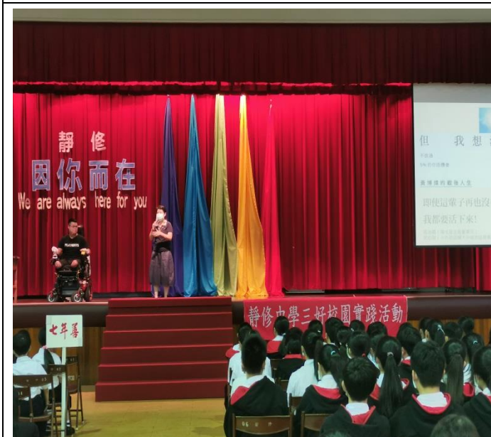
邀請生命鬥士來校演講，讓同學理解並尊重生命的價值