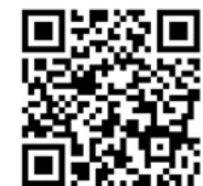
報名網站 QR CODE